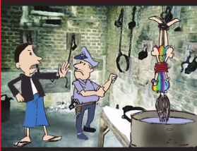
အပိုင်း (၁၀) ညှဉ်းပန်းနှိပ်စက် အပြစ်ပေးခြင်းမှ ကင်းလွတ်ခွင့်ရှိသည်။