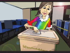
အပိုင်း (၂၅) လူမှုဘဝတွင် ပါဝင်ခွင့်ရှိသည်။