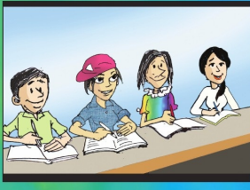
အပိုင်း (၁၆) တန်းတူညီညာသင်ခွင့်ရှိသည်။