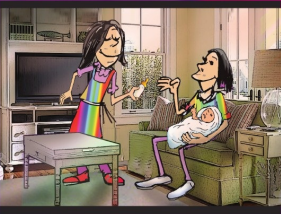
အပိုင်း (၂၄) မိသားစုထူထောင်ပိုင်ခွင့်ရှိသည်။