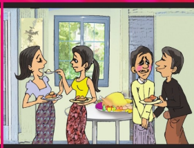
အပိုင်း (၁၄) သင့်တင့်လျောက်ပတ်သည့် လူနေမှုအဆင့်အတန်းကို ရရှိခံစားခွင့်ရှိသည်။