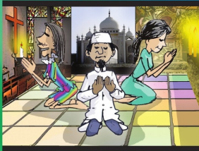
အပိုင်း (၂၁) လွတ်လပ်စွာ တွေးခေါ် ခွင့်နှင့် ဟိုးကွယ်ယုံကြည်ခွင့်ရှိသည်။