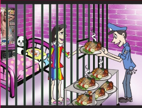
အပိုင်း (၉) ချစ်နှောင့်ထားစဉ်အတွင်း လူသားတယောက်ကိုသို့ ပြုမူထက်စပ်ပိုင်ခွင့်ရှိသည်။