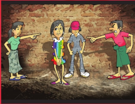
အပိုင်း (၅) လုံခြုံခွင့်ရှိသည်။