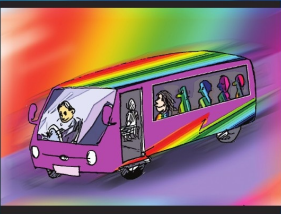
အပိုင်း (၂၂) မိမိတို့အမြင်အတွင်း လွတ်လပ်စွာသွားလာခွင့်ရှိသည်။