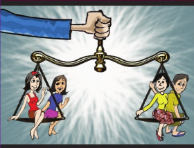
အပိုင်း (၈) မျှတသော တရားစီရင်ပိုင်ခွင့်ရှိသည်။