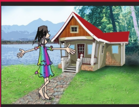
အပိုင်း (၁၅) သင့်တင့်ပြီး လုံခြုံသည့် နေအိမ်ပိုင်ခွင့်ရှိသည်။