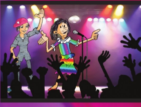
အပိုင်း (၁၉) လွတ်လပ်စွာဖွဲ့စည်းခွင့်နှင့် ထုတ်ဖော်ပြောဆိုခွင့်ရှိသည်။