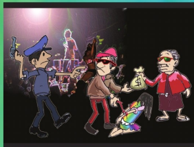
အပိုင်း (၁၁) လူ့ကုန်ကူးခြင်းနှင့် အမြတ်ထုတ်ခြင်း အမျိုးမျိုးမှ ကင်းလွတ်ခွင့်ရှိသည်။