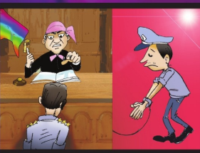
အပိုင်း (၂၉) တာဝန်ခံမှု ရရှိခွင့်ရှိသည်။