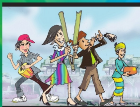
အပိုင်း (၂၆) ယာဉ်ကျေးမှုဘဝတွင် ပါဝင်ခွင့်ရှိသည်။