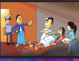
အပိုင်း (၁၈) ဆေးညှာရိပ်ရာ အလွဲသုံးစားလုပ်ငန်းမှ ကာကွယ်ပေးရမည်။