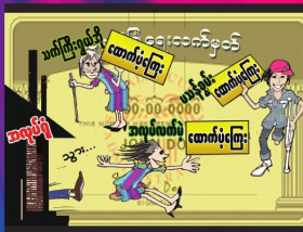
အပိုင်း (၁၃) လူမှုလုပ်ငန်းအထောက်အပံ့များ ရရှိခံစားခွင့်ရှိသည်။