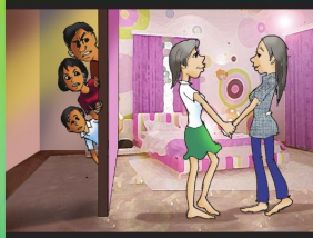
အပိုင်း (၆) ပုဂ္ဂလိကလွတ်လပ်ခွင့်ရှိသည်။