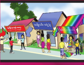
အပိုင်း (၂၀) လူတိုင်းပြီးစီးရမည့် စုဝေးပိုင်ခွင့်နှင့် အဖွဲ့အစည်း ဖွဲ့စည်းပိုင်ခွင့်ရှိသည်။