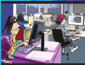
အပိုင်း (၁၂) တန်းတူအလုပ်လုပ်ခွင့်ရှိသည်။