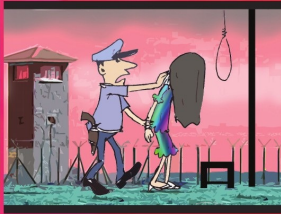
အပိုင်း (၄) အသက်ရှင်ရင်တည်ခွင့်ရှိသည်။