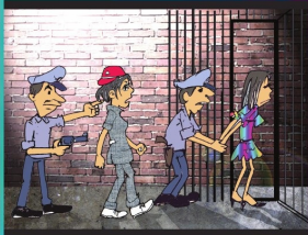
အပိုင်း (၇) မည်သူ့ကိုမှ မတရား ဖမ်းဆီးခွင့်မရှိ။