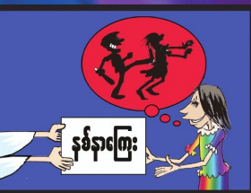
အပိုင်း (၂၈) အခွင့်အရေးမရှိစေရန်လိုအပ်သည့် ထိရောက်သော ကုစားမှု ရယူခံပိုင်ခွင့်ရှိသည်။