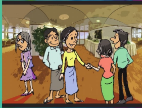
အပိုင်း (၂) ခွဲခြားထုတ်ခံမှုမှ ကင်းလွတ်ခွင့်နှင့် တန်းတူညီခွင့်ရှိသည်။