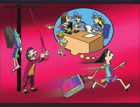
အပိုင်း (၂၃) မတရားအပြစ်ပေးခံရပါက အခြားနိုင်ငံသို့ ခိုလှုံခွင့် စတင်ခံပိုင်ခွင့်ရှိသည်။